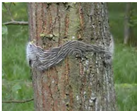
Prozession der Raupen

Die fertig ausgebildeten Jungraupen überwintern im Ei, bevor sie Anfang Mai schlüpfen. Bis zur Verpuppung Ende Juni durchlaufen die Raupen fünf bis sechs Entwicklungsstadien. Sie werden dabei bis zu fünf Zentimeter lang. Die Raupen besitzen eine breite dunkle Rückenlinie mit samtartigen Feldern und rotbraunen, langbeharten Rückenwarzen. Ab dem dritten Stadium der Entwicklung bilden sich Gifthärchen, die ein Allergie auslösendes Nesselgift enthalten.