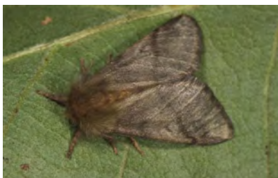
Falter des Eichenprozessionsspinners

Der Eichenprozessionsspinner ist eine Schmetterlingsart und befällt überwiegend Stiel- und Traubeneichen, in seltenen Fällen auch die Roteiche. Die Falter erreichen eine Flügelspannweite von bis zu 35 Millimetern. Ihre Flügel sind grau-braun und bei männlichen Faltern mit weißlicher Zeichnung, weibliche Falter sind nur schwach oder gar nicht gezeichnet.