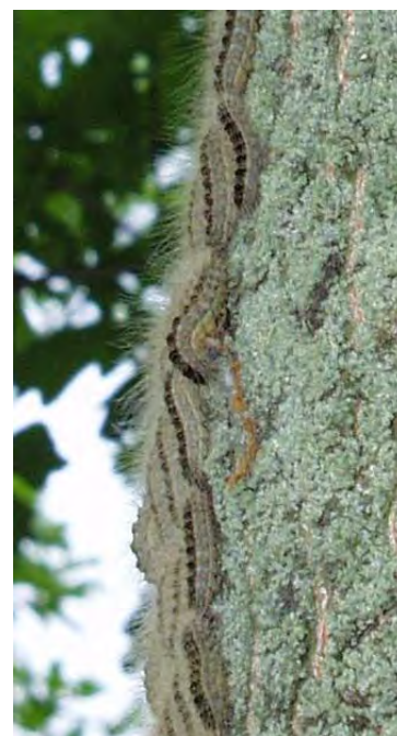
Prozession der Raupen

Mitte Juni beginnt die Prozession der Raupen. Sie wandern dabei in bis zu 10m langen Bändern am Wirtsbaum entlang (daher der Name Eichenprozessionsspinner). Mit der Verpuppung bilden sie bis zu 1 Meter große Raupenester, die mit Gespinnst umhüllt sind.