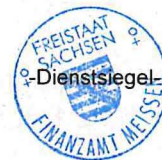
T. Schulze Sachbearbeiter

Der Widerruf dieser Bescheinigung bleibt vorbehalten.